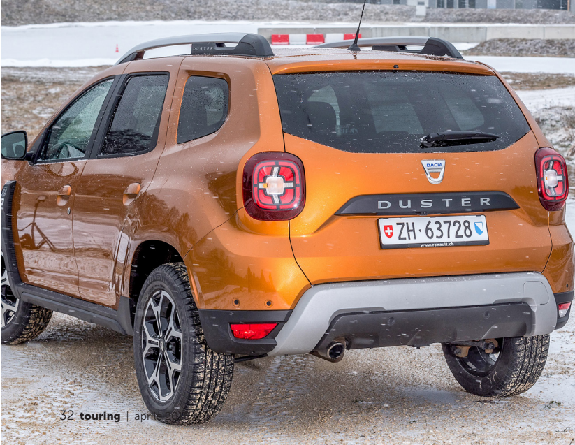
32 touring | aprile