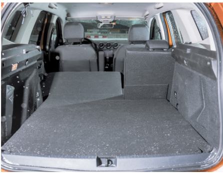
Ben configurato, il vano bagagli è spazioso.