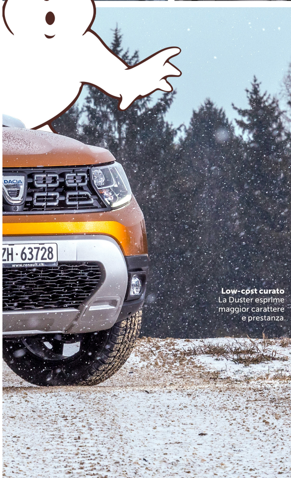
Low-cost curato La Duster esprime maggior carattere e prestanza.