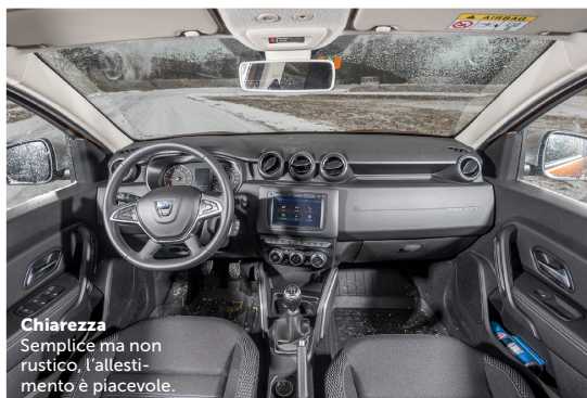
Chiarezza Semplice ma non rustico, l'allestimento è piacevole.