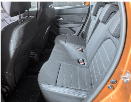
Decente, nulla più, lo spazio sui sedili dietro.