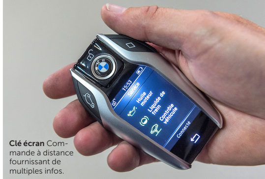
Clé écran Com- mande à distance fournissant de multiples infos.

P osté hors de la voiture, on ap- puie incrédule sur la clé écran. L'opulent break BMW 540d dé- marre et se range automatique- ment dans l'étroite place de parc lui fai- sant face. Cette fonction bluffante aux allures de gadget démontre à l'envi que ce cinquième opus est bien plus qu'une simple évolution de la Série 5. Et même si ses traits élancés sont déroutants de classicisme, ils dissimulent une re- cherche avérée de la perfection. Cette philosophie est patente dans l'habitacle empreint d'ambiance cosy et de techno- logie. Le système de commande apparaît désormais sur un écran central de 10,2 pouces. On se perd un peu dans les sous-menus, mais la molette de com- mande avec fonction pavé tactile se ré- vèle bien pratique pour introduire une destination dans le navigateur. Idem pour l'affichage tête haute aux informa- tions clairement lisibles. On recourt aussi volontiers au système de maintien de voie actif qui conserve en finesse le cap de la voiture sur autoroute. Evidem- ment, tout cela se monnaie au prix fort.