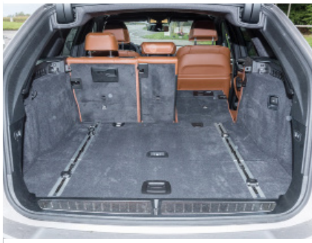
Bien configuré mais pas énorme, le coffre.