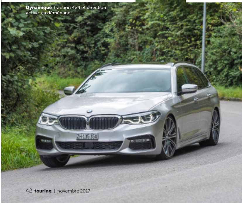
42 touring | novembre 2017