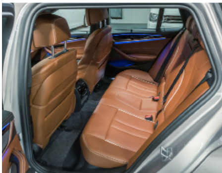
Accueillante banquette aux contours sculptés.